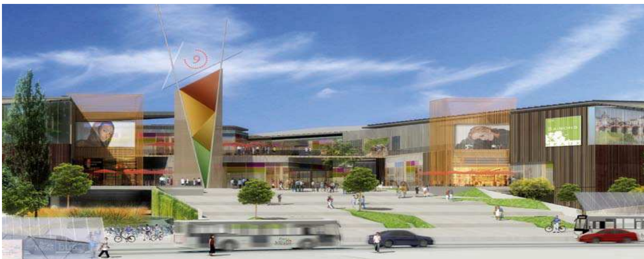
Projet Les Saisons de Meaux en région parisienne

Parmi les projets français présentés cette année sur le MAPIC,