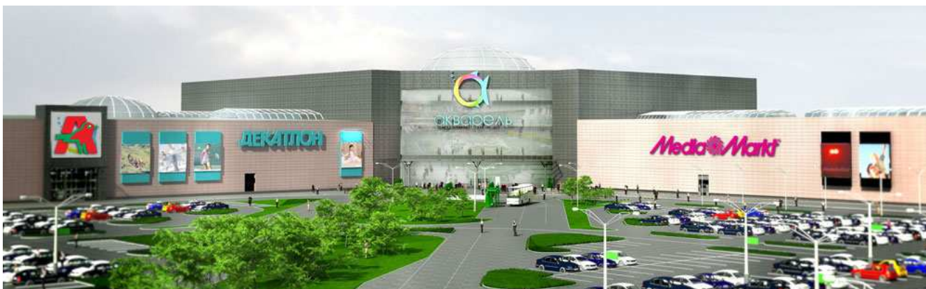
Projet Aquarelle / Russie