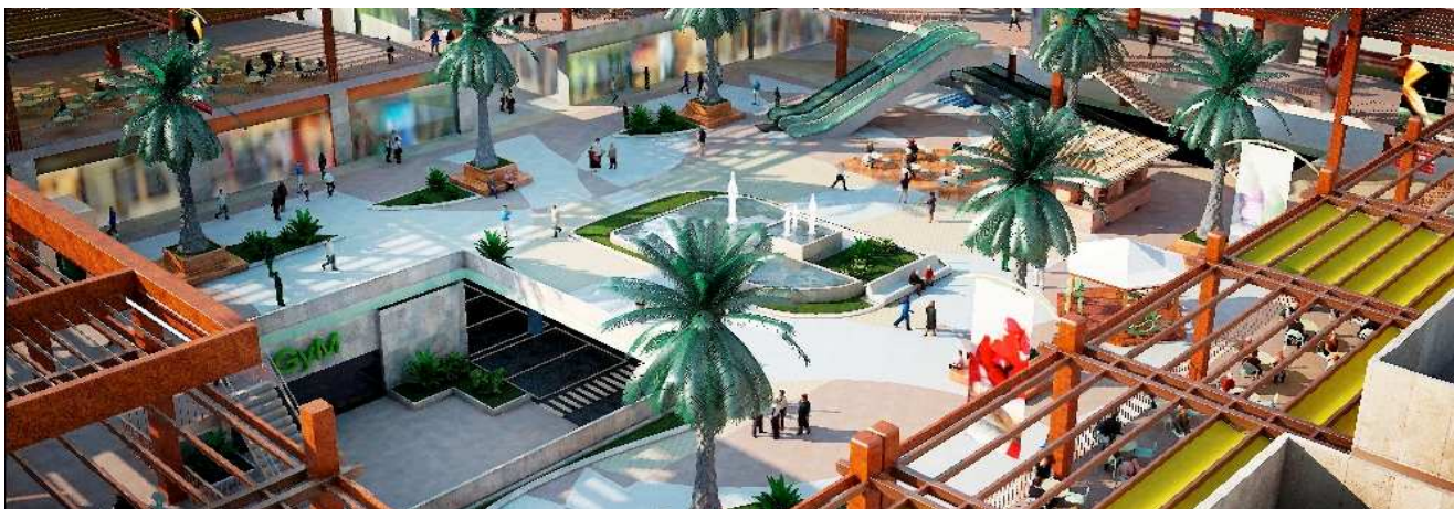
Projet Orihuela Costa - Shopping Village / Espagne